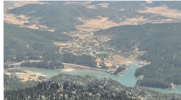
Şekil 2. Tırl tepesinden kesik yaylası