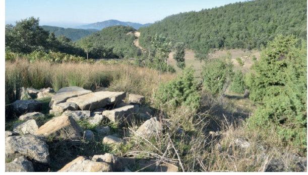
Şekil 7. Andırın Menteşe Yaylası

Dağların temiz havası sadece üst solunum rahatsızlıkları ve astım hastalarına iyi gelmiyor. Örneğin bir araştırma depresyon, saldırganlık ve stresi azalttığını gösteriyor. Başka bir araştırma ise lavanta kokusunun uyku kalitesini arttırdığını ortaya çıkardı.