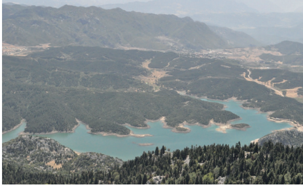
Şekil 1. Tırl dağından Andırın

Türkiye'nin hemen hemen bütün bölgelerinde yaylalara rastlamak mümkündür. Giresun-Akçalı köyü Tarsus-Namrun, İskenderun-Soğukoluk ve Belen, Kemaliye-Sarıçiçek ve Munzur, Artvin-Kafkasör, Ordu-Çambaşı, Kaş-Gömbö, Mersin-Fındıklıpınar, Kadirli-Maksutoğlu, Muğla-Karabağ yaylaları ülkenin meşhur yaylalarındandır.