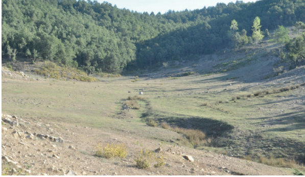
Şekil 5. Andırın Menteşe Yaylası

Journal of Epidemiology and Community Health dergisinde yayınlanan bir makale yüksek rakımlı yerlerde yaşayan kişilerin kalp hastalıklarına yakalanma riskinin daha düşük olduğunu yazıyor. Araştırmacı doktor Benjamin Honigman düşük oksijen seviyelerinin kalp kaslarının işleyişini etkileyen bir geni çalıştırdığını ve aynı genin yeni kan damarları oluşturarak kalbe kan pompalayan yeni yollar açtığını söylüyor.