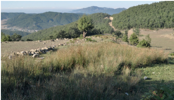
Şekil 6. Andırın Menteşe Yaylası

Dağlarda bir saatlik bir yürüyüş yaklaşık 500 kalori yakmanızı sağlar. Kaya tırmanışı ve dağ bisikleti gibi aktivitelerle saatte ortalama 650 kalori yakmak mümkün. Bunlarla birlikte ABD'nin fiziksel olarak en aktif nüfusuna sahip 10 eyaletinin dağ başında olması tesadüf olamaz.