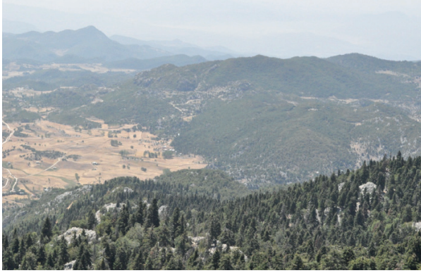
Şekil 3. Tiril tepesinden yeşilyurt bölgesi

Türklerin göçebe kültürünün bir parçası olan yaylalar, şehrin kirli havası ve stresli yaşantısından uzaklaşmak isteyenlere tertemiz hava soluma imkanı sunuyor.