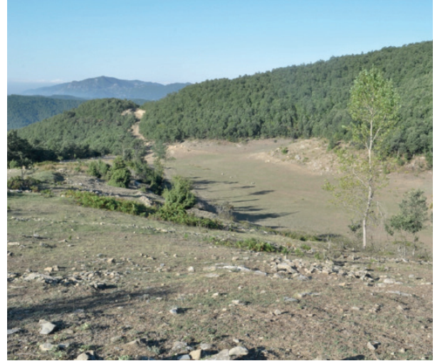
Şekil 7. Andırın Menteşe Yaylası

Dağların yaşam süresini uzattığına dair kanıtlardan biri Himalaya eteklerindeki Kaşmir bölgesindeki bir köyün dünyanın en uzun ortalama yaşam süresine sahip olması. Bir başka istatistik ise ABD'den, Chicago Tribune'de yayınlanan bir makale vatandaşlarının ortalama yaşam süresi en uzun 10 bölgeden 7'sinin Colorado'nun en yüksek yerlerinde olduğunu yazıyor.