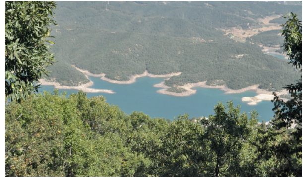
Şekil 4. Tiril tepesinden yeilurt göleti

Dağların ormanlar, temiz su, temiz hava ve kullanışlı mineralleri barındırmaları dışında, insanların hayatlarını daha kaliteli ve uzun yaşamasını sağlayan özellikleri de var.