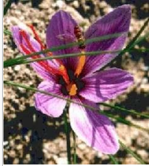
Safran çiçeği. Üç life ayrılan kırmızı uzun dişilik organı ve daha kısa olan sarı erkek organ.