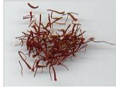
Safran lifleri olarak da adlandırılan safran tepecikleri.